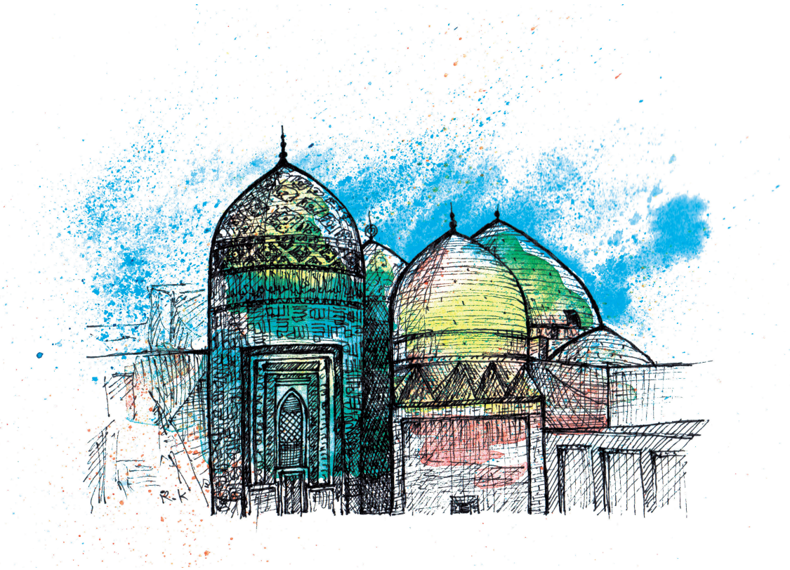
آرامگاه شیخ صفی‌الدین اردبیلی / Tomb of Sheikh Safi al-Din Ardabili