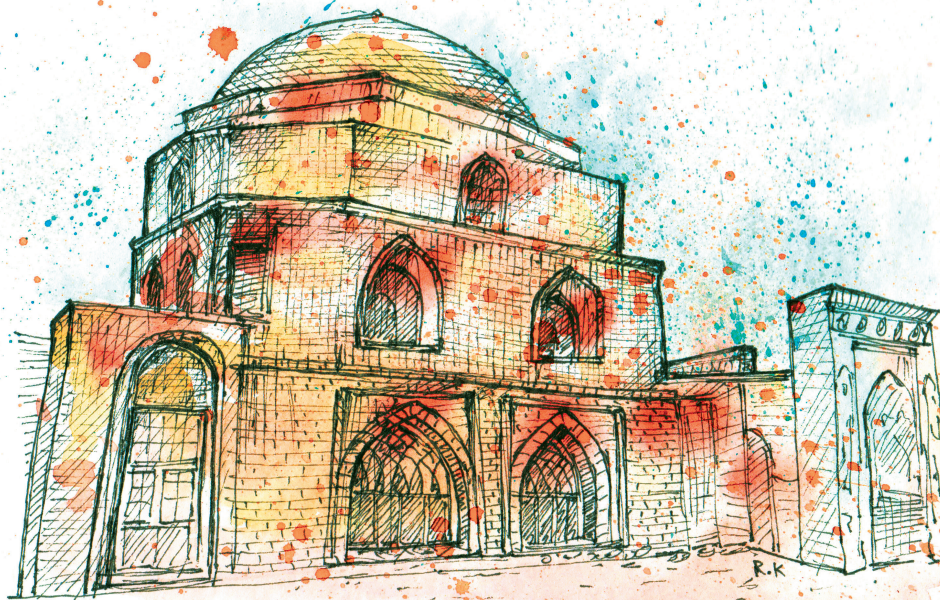
Urmia Grand Mosque / مسجد جامع ارومیه