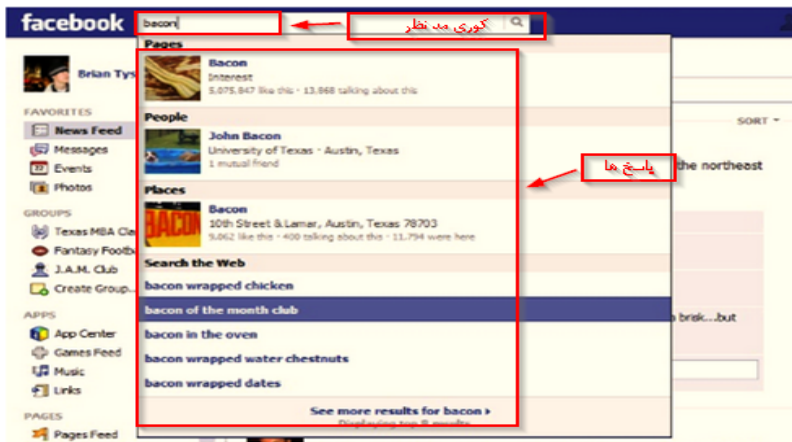
شکل ۵-۶ پاسخ‌های پیشنهادی بر اساس جستجوی وارد شده شما

فیس بوک لیستی از پیشنهادات به شما نشان داده می‌شود. می‌توانید چیزی را از لیست انتخاب کنید یا پرسش جدید مطرح کنید (شکل ۵-۶ را ببینید).