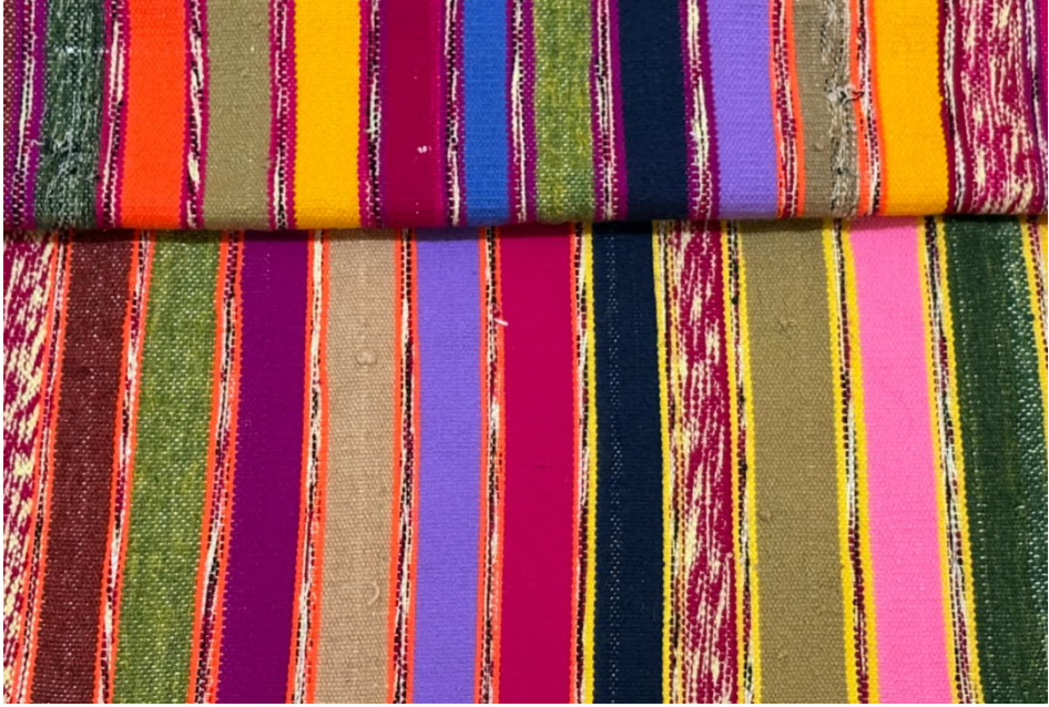
(تصویر ۱۷) بافت تک گل (نگارندگان، ۱۴۰۴)