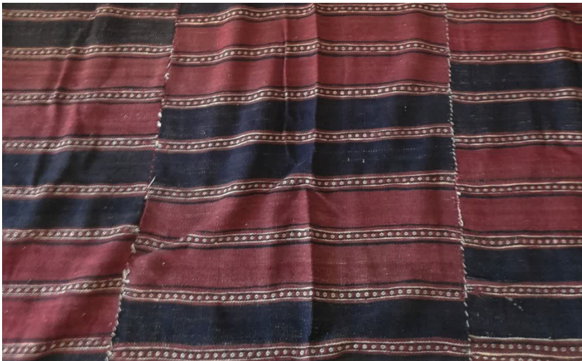
(تصویر ۱۸) بافت قرینه (نگارندگان، ۱۴۰۴)