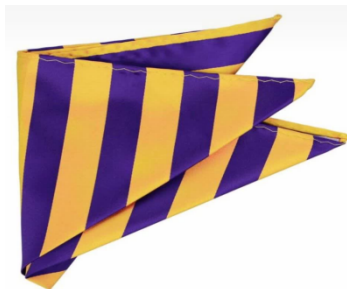
(تصویر ۱۶) اَلجِه (نگارندگان، ۱۴۰۴)

لازم به ذکر است که متاسفانه دیگر اثری از بافت مشبق و الجِه و همچنین بافت سرانه در گلیچ‌های امروزی نیست.